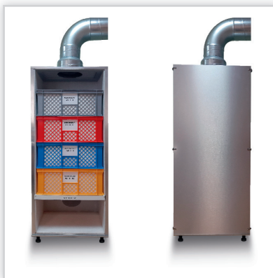
Mineralny pochłaniacz smogu SMOGSORBER do większych obiektów. Samodzielne urządzenie filtracyjne zlokalizowane, np. w garażu, na strychu lub na zewnątrz obiektu. Możliwe podłączenie do istniejącej instalacji wentylacyjnej.