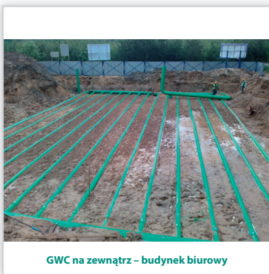
GWC na zewnątrz – budynek biurowy