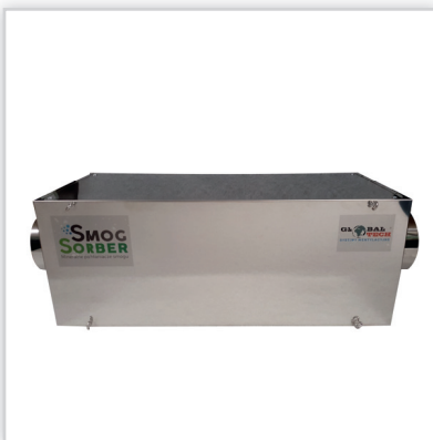
Mineralny pochłaniacz smogu SMOGSORBER do małych obiektów. Samodzielne urządzenie filtracyjne zlokalizowane, np. w garażu, na strychu lub na zewnątrz obiektu. Możliwe podłączenie do istniejącej instalacji wentylacyjnej.