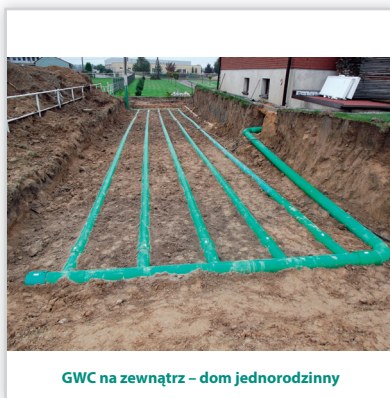
GWC na zewnątrz – dom jednorodzinny