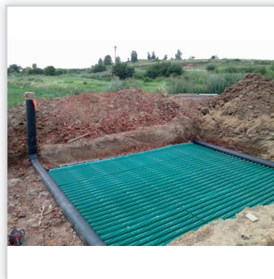
Gruntowy wymiennik ciepła GEOSTRONG – na zewnątrz domu. GWC bezprzeponowy modułowy. Przepływ powietrza turbulentny, wymiana ciepła ze wszystkich stron GWC. Wytrzymałość na nacisk z góry: 460 t/m 2 . Zastosowanie: w wentylacji mechanicznej we współpracy z rekuperatorem w domach jednorodzinnych, wielorodzinnych. Możliwość wykonania GWC o każdej wielkości przepływu powietrza. Możliwość samodzielnego montażu.