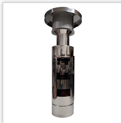
Mineralny pochłaniacz smogu SMOGSTRONG do zastosowania we współpracy z każdym rozwiązaniem GWC.