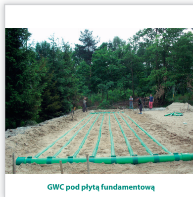
GWC pod płytą fundamentową